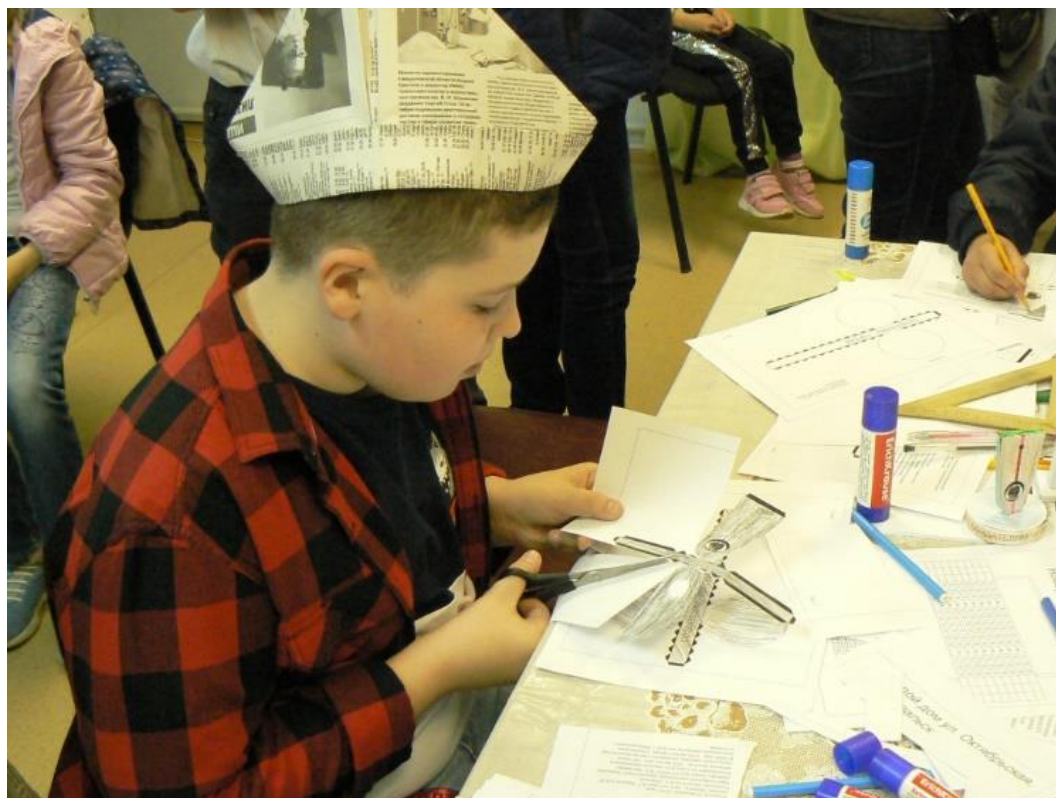
Рисунок 1. Создание 3D-модели архитектурно-художественной композиции «Создателям города» в г. Новоуральск в рамках «Ночи-музеев – 2018»

Интернет. Учитывая, что во многих городах есть аллеи, скверы, на которых установлено несколько объектов, то можно говорить о возможностях изменения ландшафтного облика городской среды. Для формирования исходных данных для последующих экскурсий школьники заполняют информационные карточки. С методикой создания архитектурных объектов можно познакомиться в статьях Жданова А.О. «3D-моделирование как способ представления результатов краеведческих исследований школьников» [2, С.206]. В статье Жданова А.О., Шерер А.А. «Бумажное моделирование как фиксация изменений архитектурного ландшафта» [3, С. 283] показан пример изменения облика мемориального комплекса «Звездочка» в Парке Победы г. Кудымкар (Пермский край). Объекты могут быть как плоскими, так и объемными.